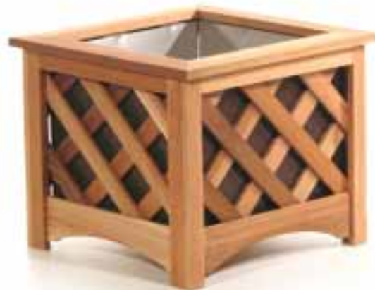
A (#GA18SB) Lattice Box / Brown Jardinière en treillis / Marron

Products shown here have been photographed with a variety of stains and finishes applied. SCHOLS products are sold unfinished. Les produits illustrés ici ont été photographiés avec des teintures et des peintures de finition. Les produits SCHOLS sont vendus non finis.