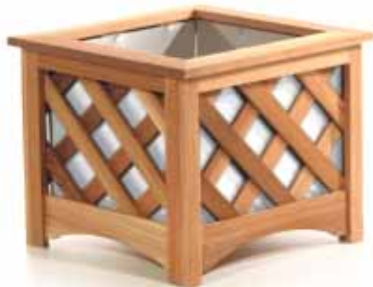
C (#GA18SW) Lattice Box / White Jardinière en treillis / Blanc