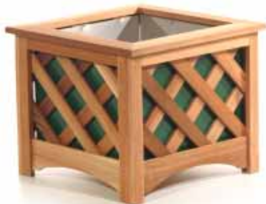
B (#GA18SG) Lattice Box / Green Jardinière en treillis / Vert