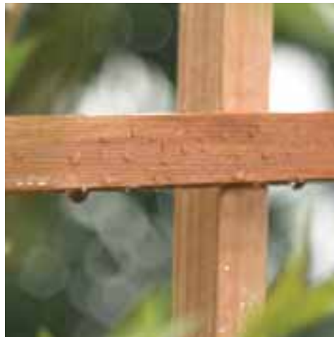
(#GT37) Trellis with Square Lattice Treillage avec treillis carré