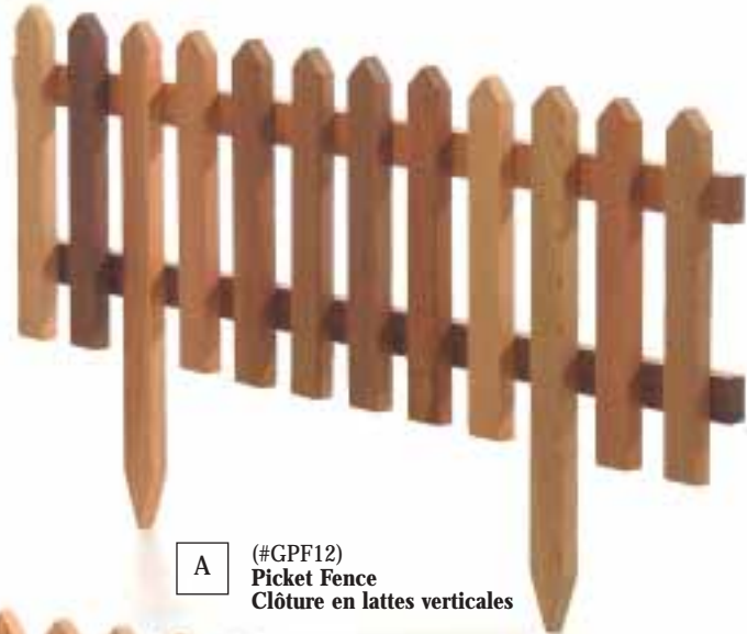
A (#GPF12) Picket Fence Clôture en lattes verticales

Products shown here have been photographed with a variety of stains and finishes applied. SCHOLS products are sold unfinished. Les produits illustrés ici ont été photographiés avec des teintures et des peintures de finition. Les produits SCHOLS sont vendus non finis.